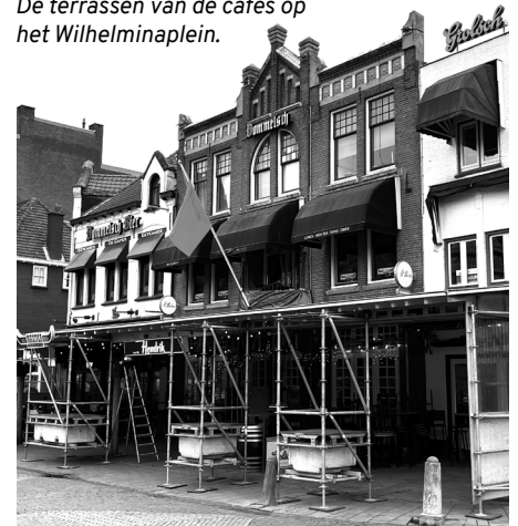
De terrassen van de cafés op het Wilhelminaplein.