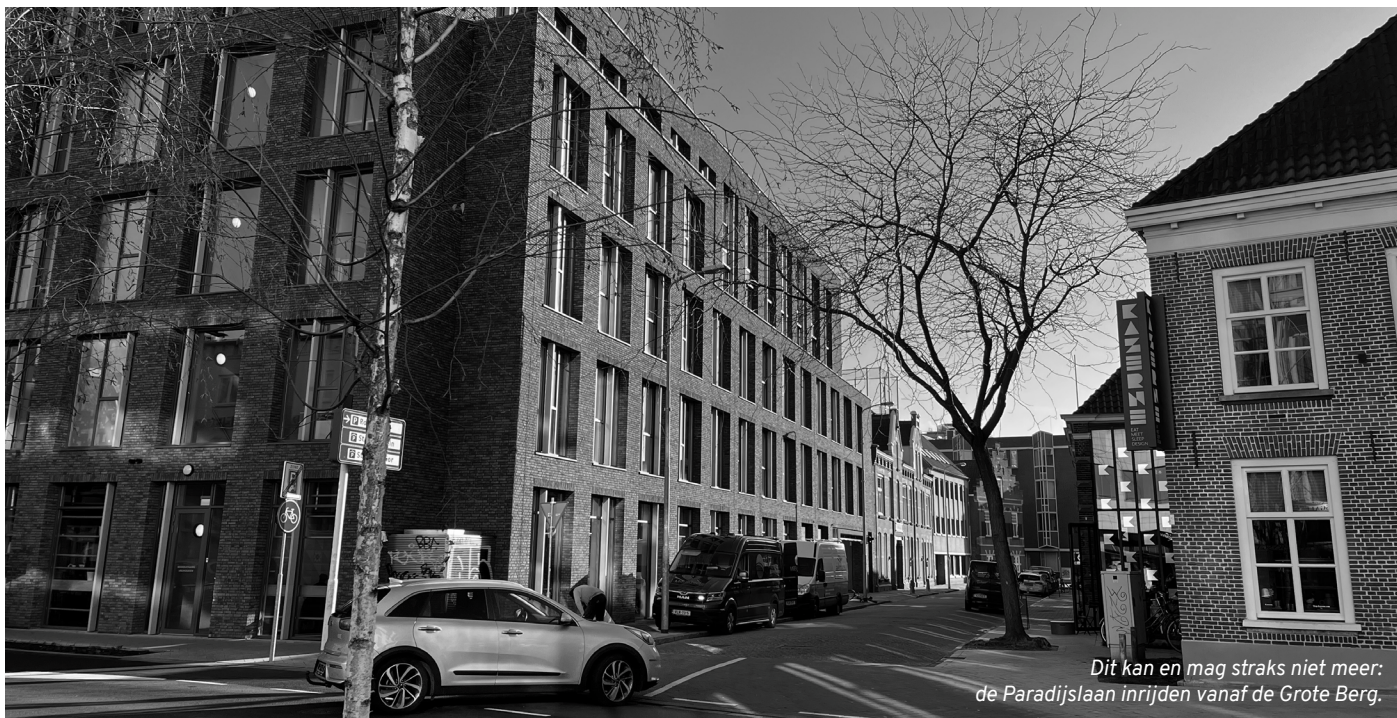
Dit kan en mag straks niet meer: de Paradijslaan inrijden vanaf de Grote Berg.