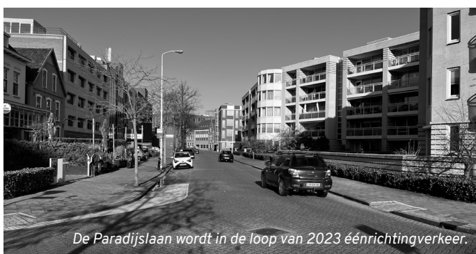
De Paradijslaan wordt in de loop van 2023 éénrichtingverkeer.

‘De maatregel is draconisch, maar het is de enige manier om de dagelijks verkeersstroom af te remmen.’ Zo stellen betrokken buurtbewoners op een door de gemeente georganiseerde inloopavond. Niet alle buurtbewoners zijn blij met de voorgenoemde plannen. Een enkeling uit de Elzent vindt het éénrichtingsverkeer en het afsluiten van de brug op de Paradijslaan en dus het moeten omrijden niet nodig. Bewoners van de Paradijslaan zelf ondervinden al jaren hinder van veel doorgaand verkeer, dat bovendien ook nog vaak hard rijdt.