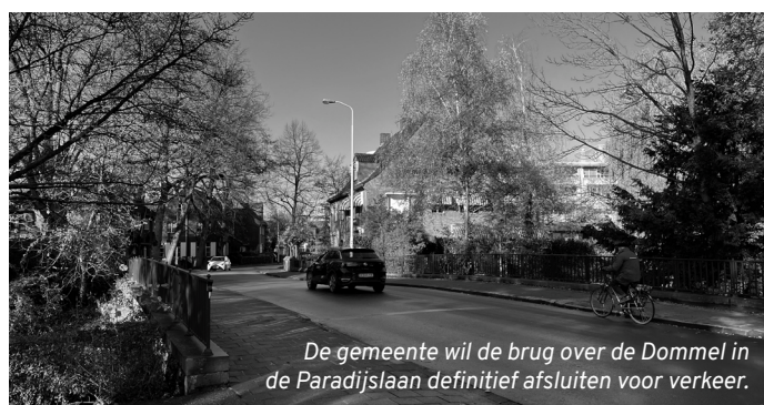
De gemeente wil de brug over de Dommel in de Paradijslaan definitief afsluiten voor verkeer.