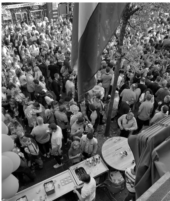
Grote drukte op de Kleine Berg op Koningsdag 2022.