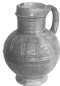
2: Voorbeeld van een steengoed Raeren kan/kruik uit de eerste helft van de 17e eeuw.

Het bouwkeramiek bestaat uit in totaal acht stukken: drie stukken plavuiz (twee rood, een grijs) met mortel en kalkresten,