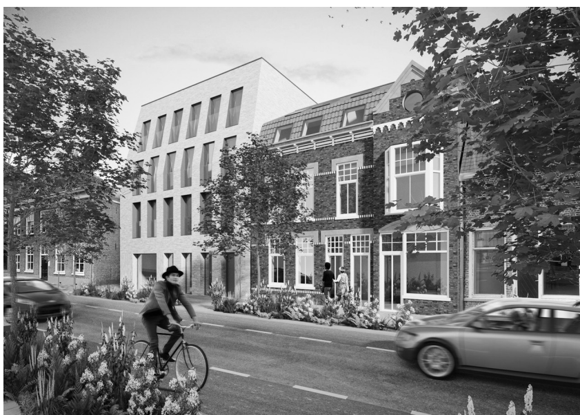
Het nieuwbouwplan op de Grote Berg. Het Ridderlijke Gilde van Sint-Sebastiaan is het niet met de plannen eens.