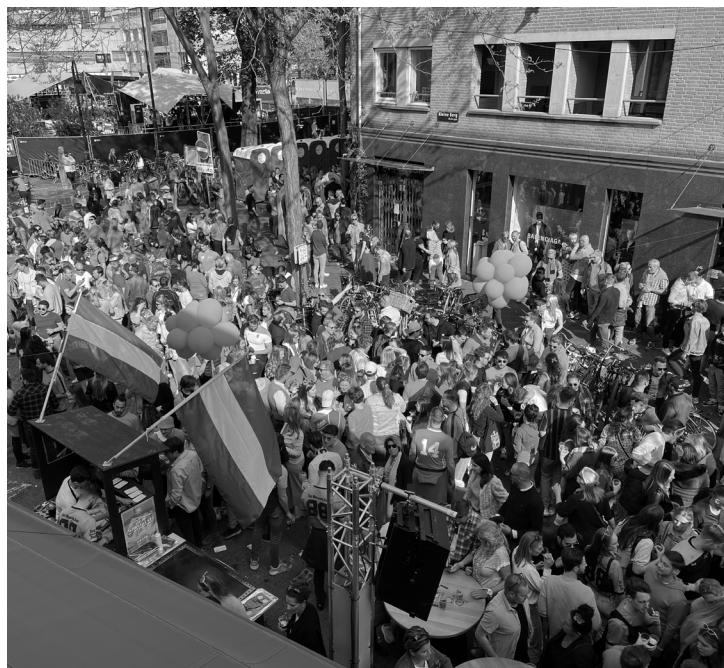
Koningsdag 2022 op de Kleine Berg. Na twee Corona-jaren trok het evenement enkele duizenden mensen.

Op Koningsdag 2022 hadden vrijwel alle horecabedrijven een buitenbar en stond er om de 200 meter een dj muziek te draaien. Dat trok -mede door het mooie weer- enkele duizenden mensen naar de Kleine Berg. „Er was blijkbaar een ambulance nodig voor iemand, die z'n been gebroken had. Die ambulance kon zich maar met moeite een weg door alle mensen heen banen. Dat was voor de gemeente het teken om onze plannen voor dit jaar af te keuren”, zegt Retera.