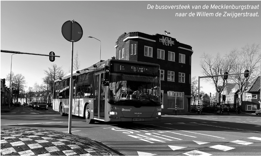
De busoversteek van de Mecklenburgstraat naar de Willem de Zwijgerstraat.