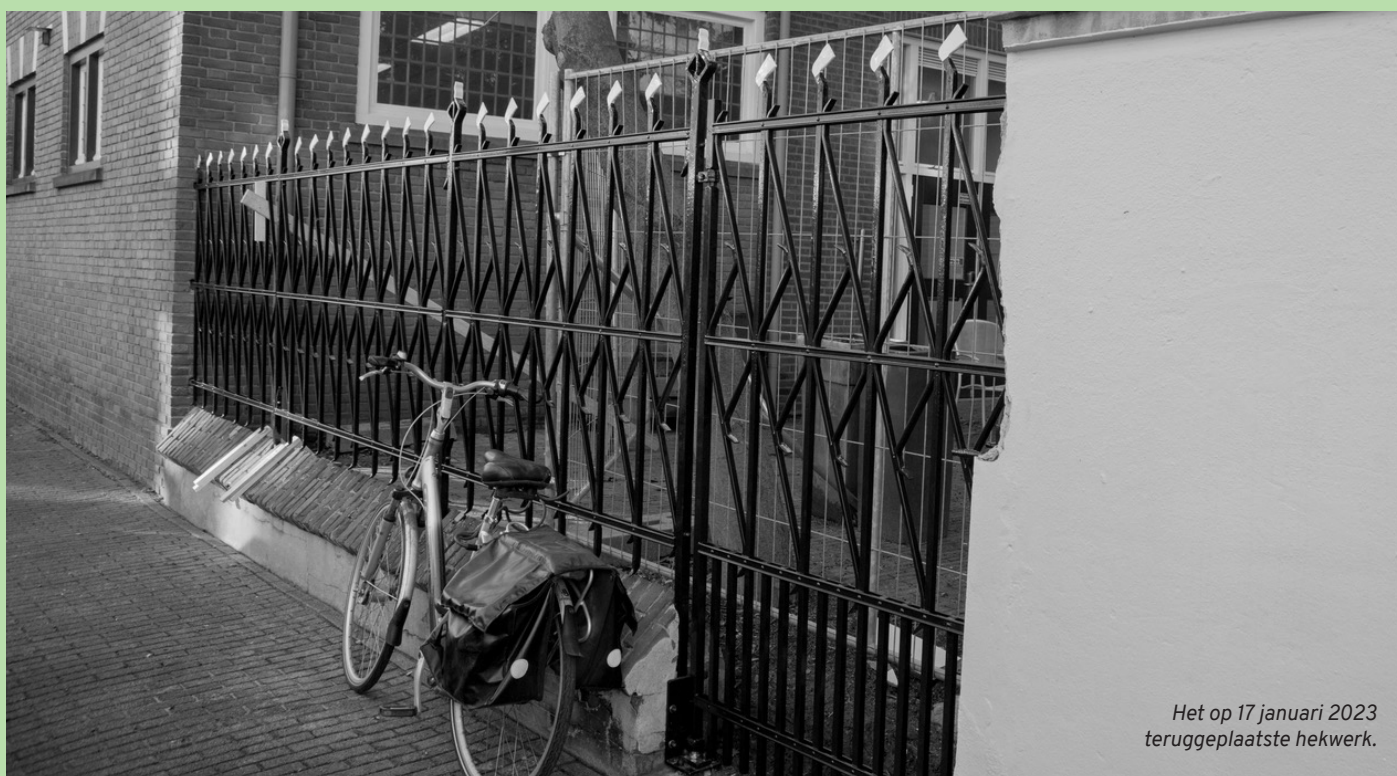
Het op 17 januari 2023 teruggeplaatste hekwerk.

Wellicht heeft deze brief de doorslag gegeven bij Lunetzorg om het hek te herstellen. De bewoners zijn er in elk geval blij mee. "Het heeft wat moeite gekost om de eigenaar tot restauratie te bewegen, maar het resultaat is dat dit stukje monumentaal erfgoed voor Eindhoven en de buurt is behouden. De vlaggetjes op de spijlen zijn al uit!", zo zeggen de bewoners.