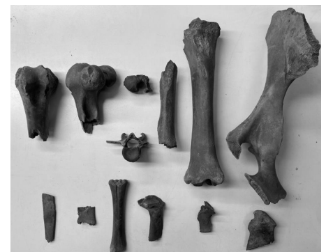
3: Aangetroffen botter bij het archeologisch onderzoek aan de Heilige Geeststraat

Het algemene beeld komt overeen met het beeld dat cartograaf Jacob van Deventer rond 1560 tekent van de Bergen. Het betreft hier het bebouwde uiteinde van de stad. Het beeld van het reguliere drink en eetgerei zal richting het Wilhelminaplein, dat destijds in het Genderdal lag, zeer waarschijnlijk afnemen.